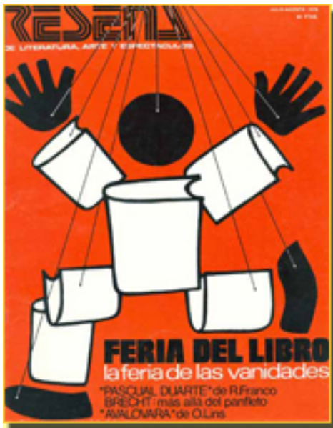
RESEÑA, 1976 NUM. 97, pp. 20- 21

Lunes, 05 de Abril de 2010 06:02 - Actualizado Jueves, 29 de Abril de 2010 18:35