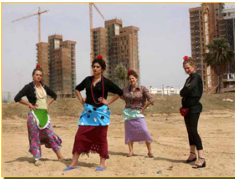
PERSONAJES PROVENIENTES DE LA MISMA VIDA

- ...ya nos rondaba la idea de traducción de los que conceptualmente, en los discursos institucionales, se expresan y formalizan por