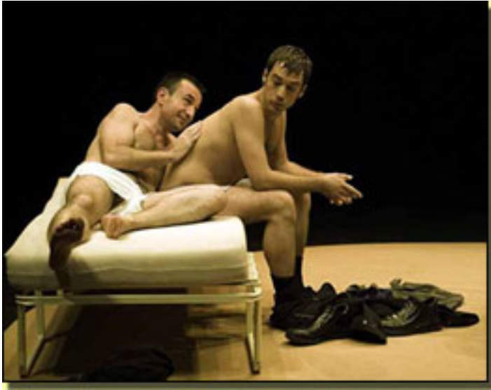
Tíos Vivos es