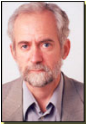
Eduardo Pérez – Rasilla Copyright©pérezrasilla

Domingo, 07 de Febrero de 2010 07:54 - Actualizado Sábado, 24 de Abril de 2010 19:35