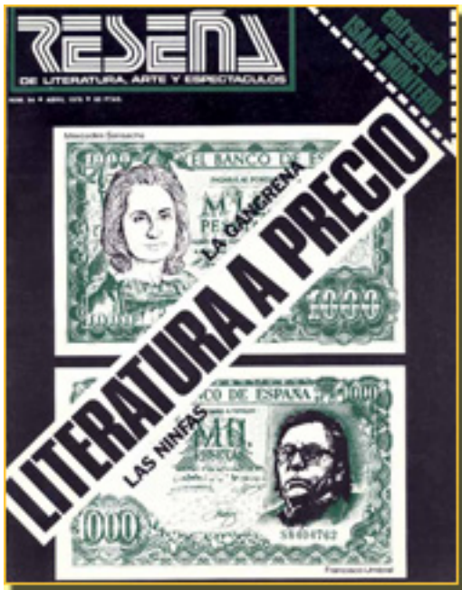
RESEÑA, 1976 NUM, 94, pp.29-30

Viernes, 12 de Febrero de 2010 13:08 - Actualizado Lunes, 03 de Mayo de 2010 08:43