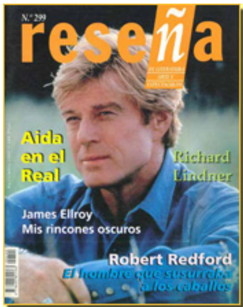
RESEÑA, 1998 NUM, 299, pp. 33