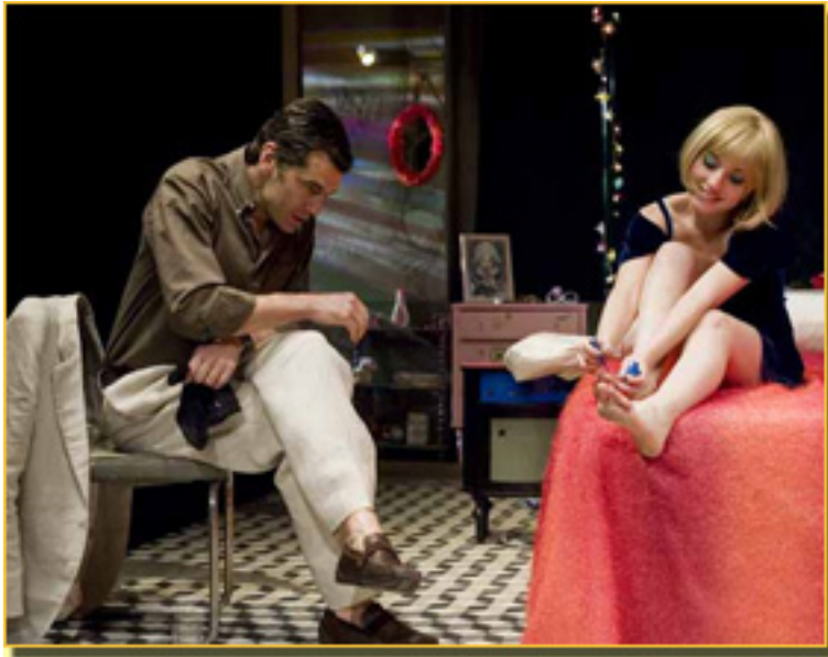
TONI CANTÓ/MARÍA VALVERDE

Lunes, 08 de Febrero de 2010 12:39 - Actualizado Miércoles, 07 de Julio de 2010 20:17