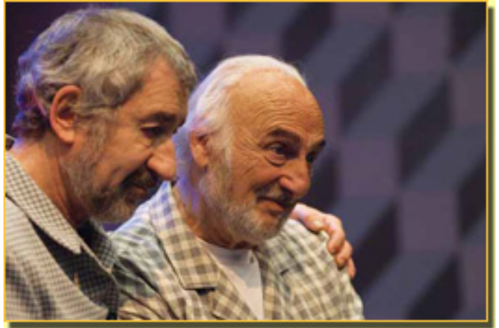
PEPE SACRISTÁN/HÉCTOR ALTERIO

Estreno en Madrid: Teatro Fernán Gómez, 15 – I -2009