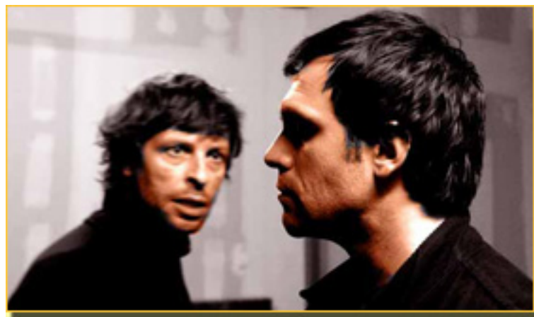
PABLO RIVERO/ALBERTO IGLESIAS

- En los años 80 el teatro de compañías fue muy Javier -