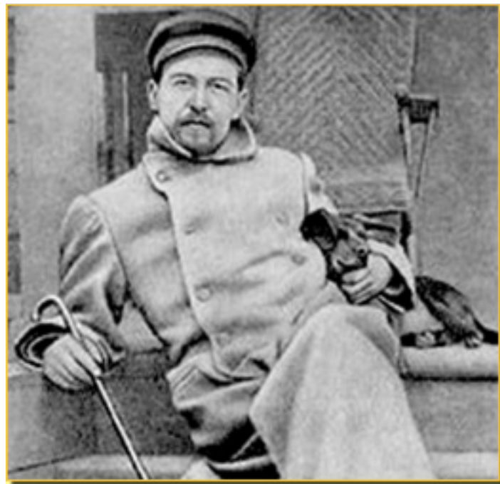
ANTON P. CHÉJOV en su finca en Mélijovo

- Por parte de los organizadores del Festival nos dieron una lista de textos de los que se iba a elegir uno. Entre ellos estaba el de Platonov que nos pareció el más interesante.