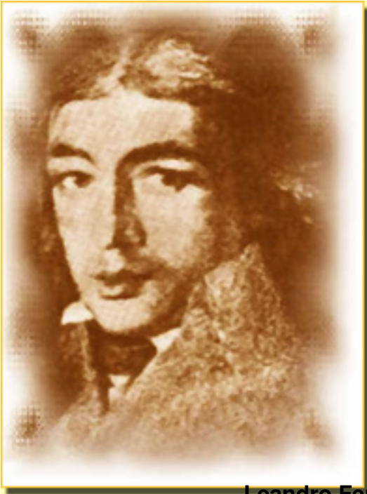
Leandro Fernández de Moratín, FERNÁNDEZ DE MORATÍN, Leandro Fernández de Moratín

Sábado, 20 de Marzo de 2010 18:42 - Actualizado Sábado, 10 de Julio de 2010 16:26