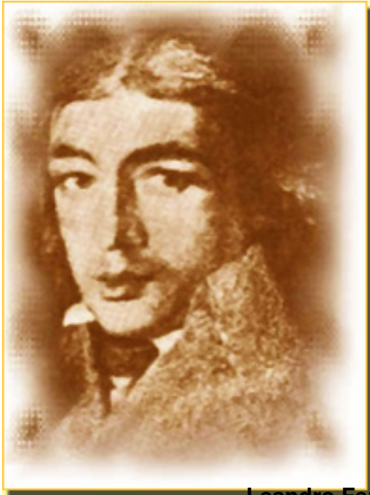
Leandro Fernández de Moratín, FERNÁNDEZ DE MORATÍN, Leandro Moratín

Sábado, 20 de Marzo de 2010 18:42 - Actualizado Sábado, 10 de Julio de 2010 16:26