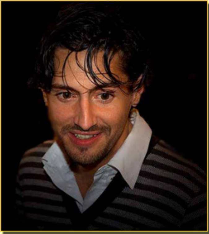
JUAN DIEGO BOTTO