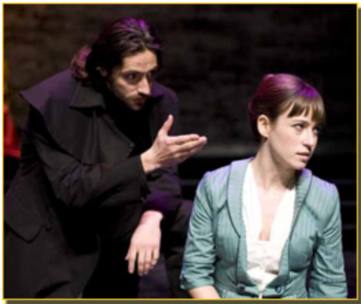
JUAN DIEGO BOTTO/MARTA ETURA

Sábado, 20 de Marzo de 2010 18:11 - Actualizado Domingo, 31 de Mayo de 2020 16:18