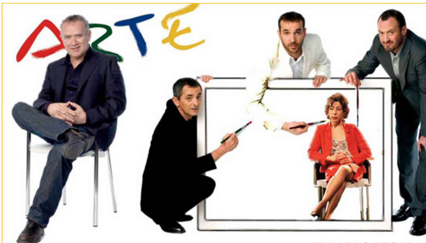
EL CUADRO de Juan Carlos Corazza.