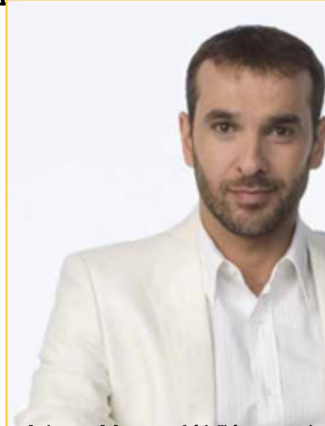
¿QUÉ PASA? de Juan Carlos Corazza.