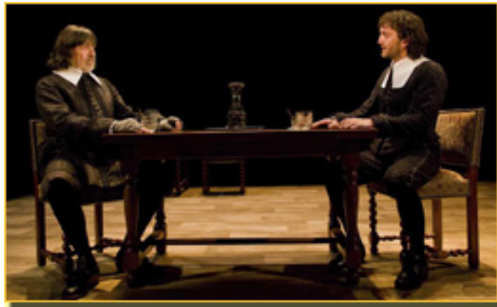
J.M. FLOTATS/ A. TRIOLA FOTO: SERGIO PARRA

- Lo fantástico es que el verbo juega con los síes acciones con existencia esencial, la