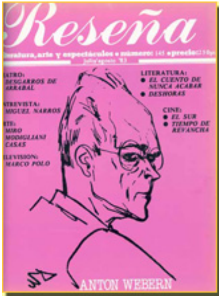
RESEÑA 1983 pp.22-23 NUM. 145,

Domingo, 04 de Abril de 2010 06:18 - Actualizado Sábado, 01 de Mayo de 2010 13:45