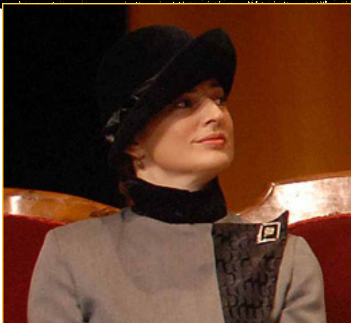
En imposible, en principio, pero para Manuel no lo es: