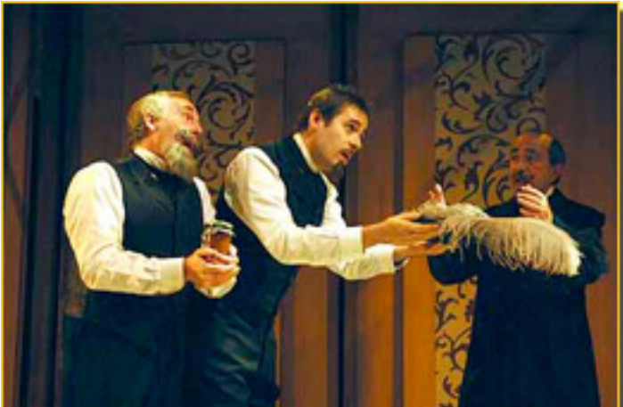
DOMAR A UNA CONEJITA TIEMPO QUE EN CORREN

Sábado, 20 de Marzo de 2010 16:24 - Actualizado Sábado, 15 de Mayo de 2010 11:33