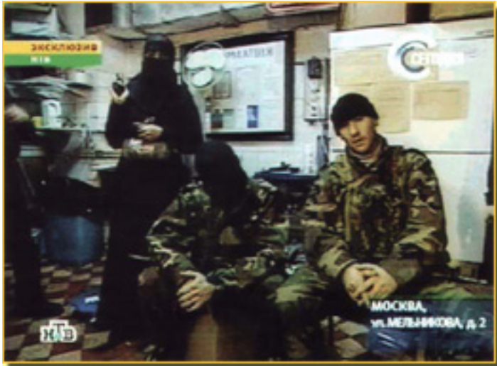
25 DE OCTUBRE, NTV, entrevista con los asaltantes y con MOVSAR BARAYEV

Sábado, 20 de Marzo de 2010 16:08 - Actualizado Sábado, 15 de Mayo de 2010 11:35