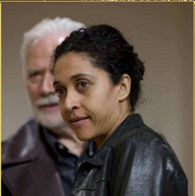
MACBETH, el rey de Escocia, en la película 'Macbeth'.