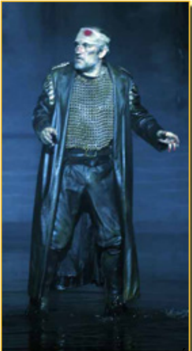
MACBETH, el rey de Escocia, en la película 'Macbeth'.

Sábado, 20 de Marzo de 2010 11:17 - Actualizado Sábado, 01 de Mayo de 2010 13:12