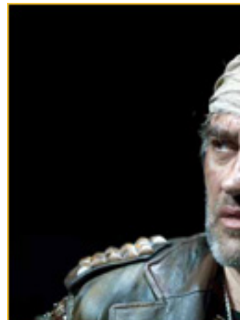
MACBETH, el rey de Escocia, en la película 'Macbeth'.