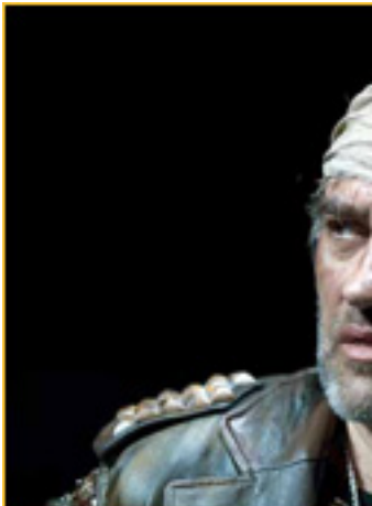
MACBETH, el rey de Escocia, en la película 'Macbeth'.