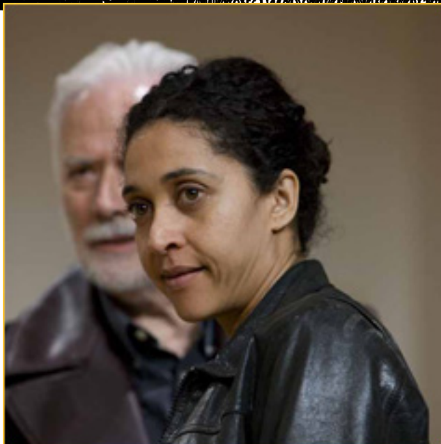
MACBETH, el rey de Escocia, en la película 'Macbeth'.