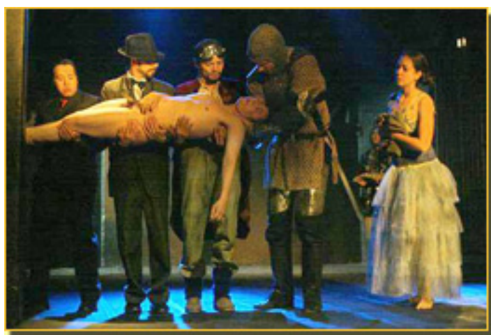
LITORAL (Versión Mexicana, 2007) (La Cuarta pared, México Año 1 n. 1)

EL TEATRO: EL DESPERTAR DE NUESTRA VIDA ADORMECIDA