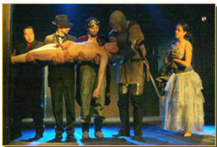
LITORAL (Versión Mexicana, 2007) (La Cuarta pared, México Año 1 n. 1)

EL TEATRO: EL DESPERTAR DE NUESTRA VIDA ADORMECIDA