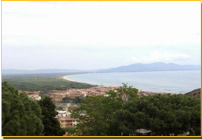
LA COSTA DE

Sábado, 20 de Marzo de 2010 10:02 - Actualizado Jueves, 16 de Septiembre de 2010 10:56