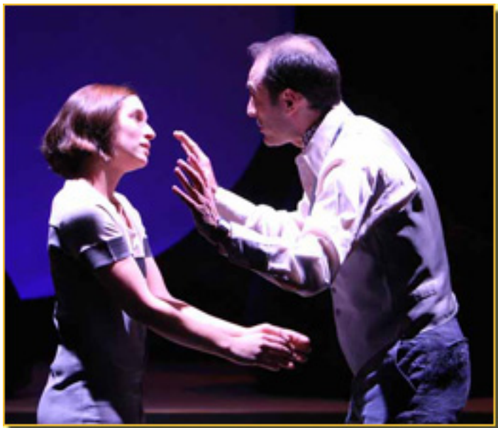
SILENCIO...VIVIMOS