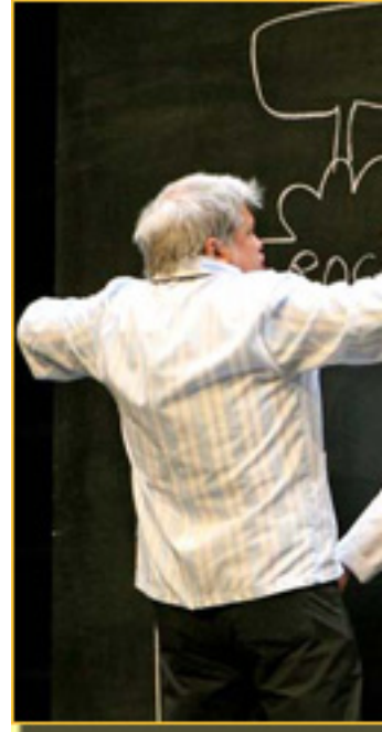
Tricicle