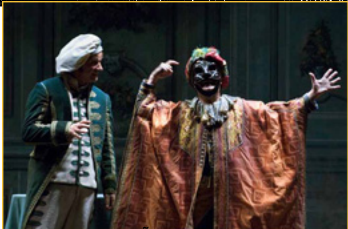
EL TEATRO DE LA COMEDIA EN MADRID.