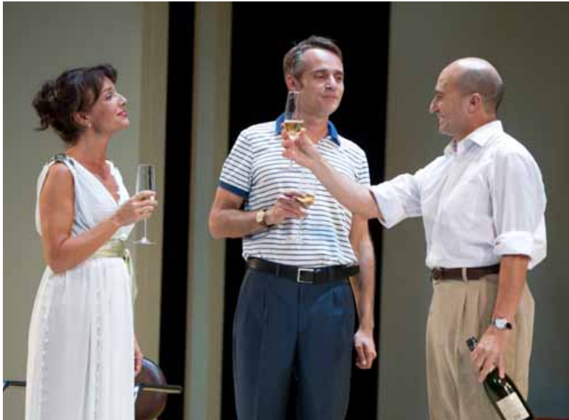
SUSANA HERNÁNDEZ / CARLES MOREU / PEPE VIYUELA

Pepe Viyuela es de sobras conocido por el gran público de televisión, debido a su intervención en la serie televisiva Aída . Tiene un amplio "currículum" como intérprete teatral desde 1988, así como de cine. Es, también, autor de una serie de libros.