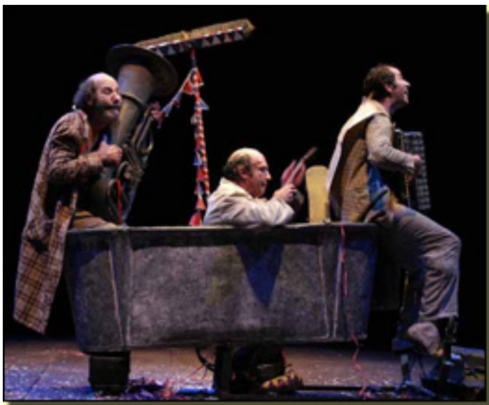
Aunque lo que definitivamente Crítica 2 separa a las c

Sábado, 27 de Marzo de 2010 20:18 - Actualizado Jueves, 29 de Abril de 2010 11:53