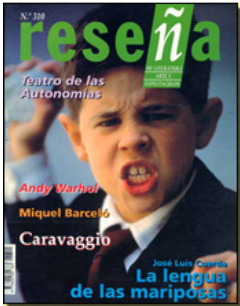
RESEÑA 1999 NUM. 310, pp. 31-32

Sábado, 27 de Marzo de 2010 18:49 - Actualizado Jueves, 29 de Abril de 2010 15:49