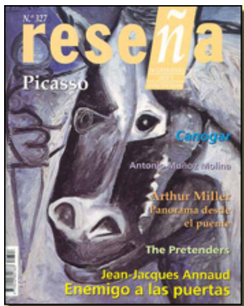
RESEÑA, 2001 NUM. 327 PP. 30

Sábado, 27 de Marzo de 2010 18:31 - Actualizado Jueves, 29 de Abril de 2010 16:24