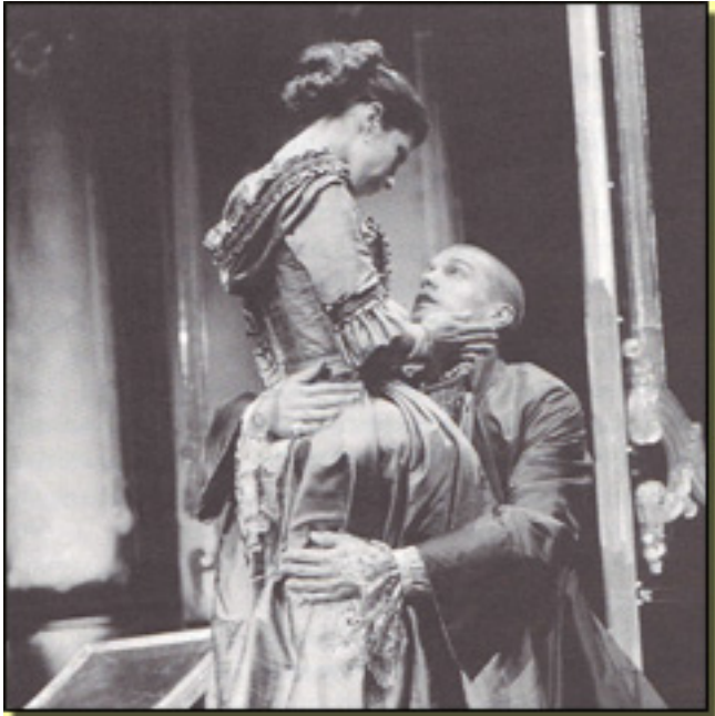
MARIBEL VERDÚ/TONI CANTÓ