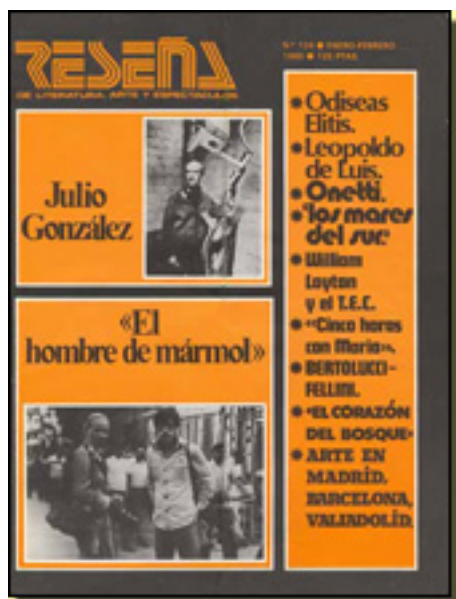
RESEÑA, 1980 NUM. 124, pp. 16

Sábado, 27 de Marzo de 2010 18:02 - Actualizado Jueves, 29 de Abril de 2010 17:02