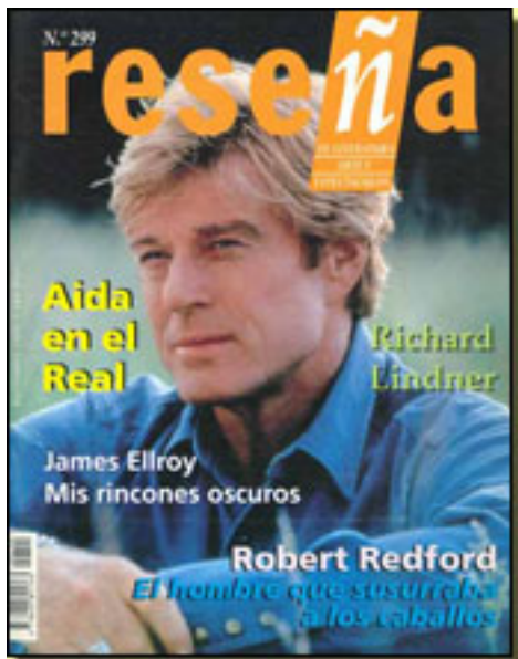
RESEÑA 1998 NUM. 299, pp. 33 - 34

Sábado, 27 de Marzo de 2010 14:38 - Actualizado Sábado, 01 de Mayo de 2010 08:41