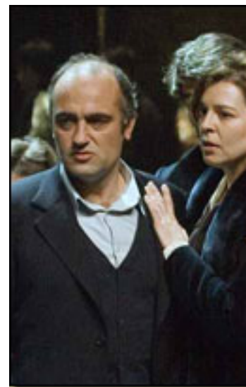
F. ORELLA/O.MOLINA/E. GELABERTH