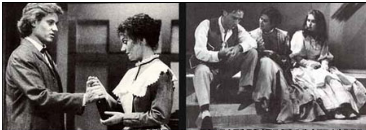
FOTOGRAFÍAS DE LA OBRA "UN ENEMIGO DEL PUEBLO" (D. STRANDBERG, 1994)