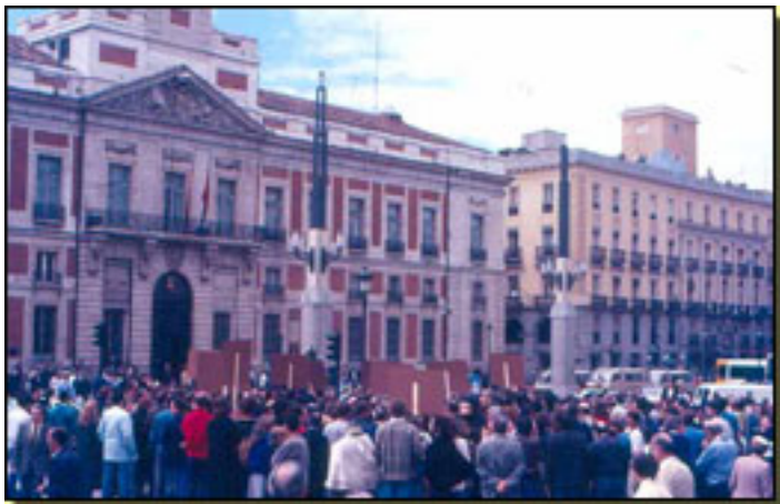
PUERTA DEL SOL (HUELGA ACTORES, 1988) FOTO: J. R. DÍAZ S.

Escrito por José R. Dóaz Sande. Jueves, 18 de Marzo de 2010 08:32 -