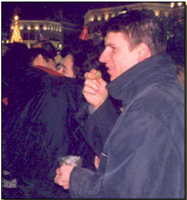
BESOS Y UVAS EN LA PUERTA DEL SOL (NOCHEVIEJA 2000, LAS 12 CAMPANADAS)

Escrito por José R. Dóaz Sande. Jueves, 18 de Marzo de 2010 08:32 -