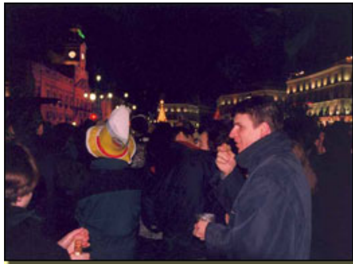
NOCHEVIEJA PUERTA DEL SOL

La obra ya ha recorrido un pequeño periplo. Un primer pase fue en el Centro Nicolás Salmerón , local en el que se había ensayado. Fue el pistoletazo de salida, una vez que se tuvo la oportunidad de confrontarlo con el público. Después vino Alicante en la Muestra de Autores Españoles de 2006 , en la cual se homenajeaba a Jerónimo López Mozo . A continuación le tocó el turno a Sevilla,