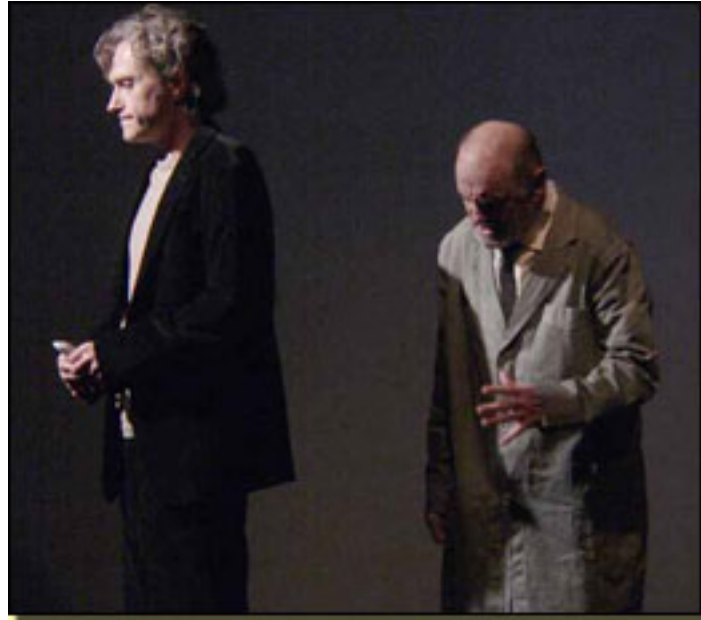
GARY PIQUER/ANTONIO CANAL

- Yo recuerdo a dos trabajadores de la empresa de mi padre. Eran maestros titulares en la Repúbli