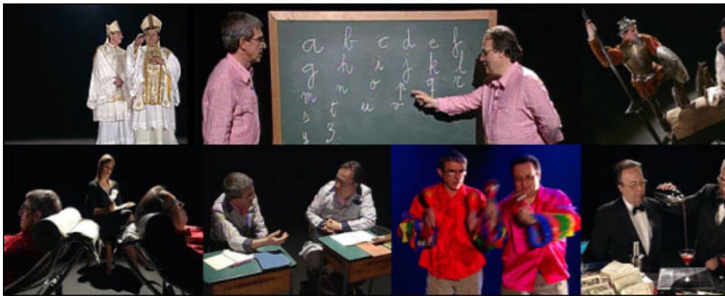
L'illa del tresor (Canal 33 de Televisión de Catalunya)