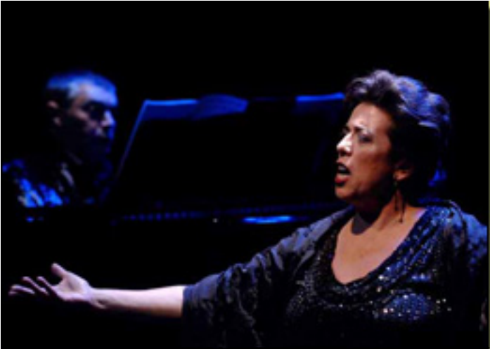
El dúo de los cantantes de la Ópera de la Real de Madrid en un momento de la actuación.

Viernes, 19 de Marzo de 2010 19:14 - Actualizado Viernes, 07 de Mayo de 2010 18:33