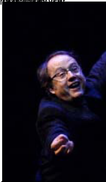
El dúo de los cantantes de la Ópera de la Real de Madrid en un momento de la actuación.