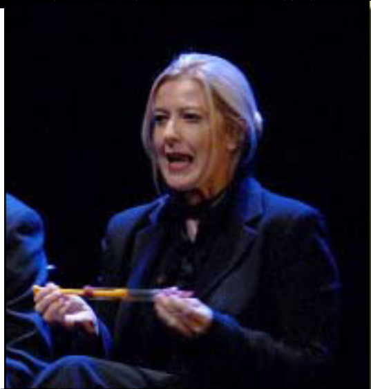
El dúo de los cantantes de la Ópera de la Real de Madrid en un momento de la actuación.