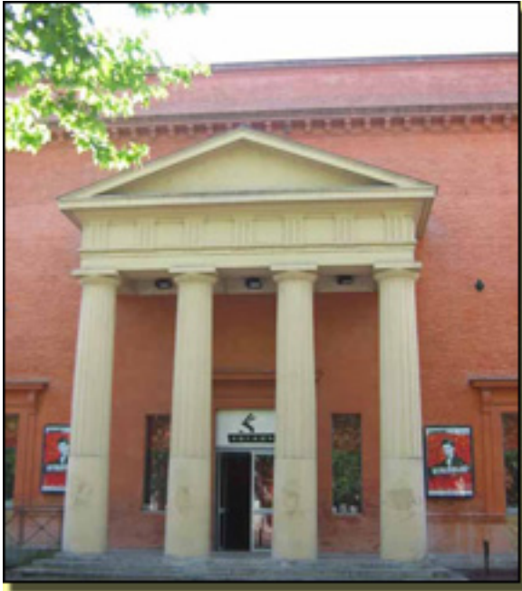
TEATRO SORANO (TOULOUSE, FRANCIA)

Viernes, 19 de Marzo de 2010 19:08 - Actualizado Jueves, 29 de Abril de 2010 11:57