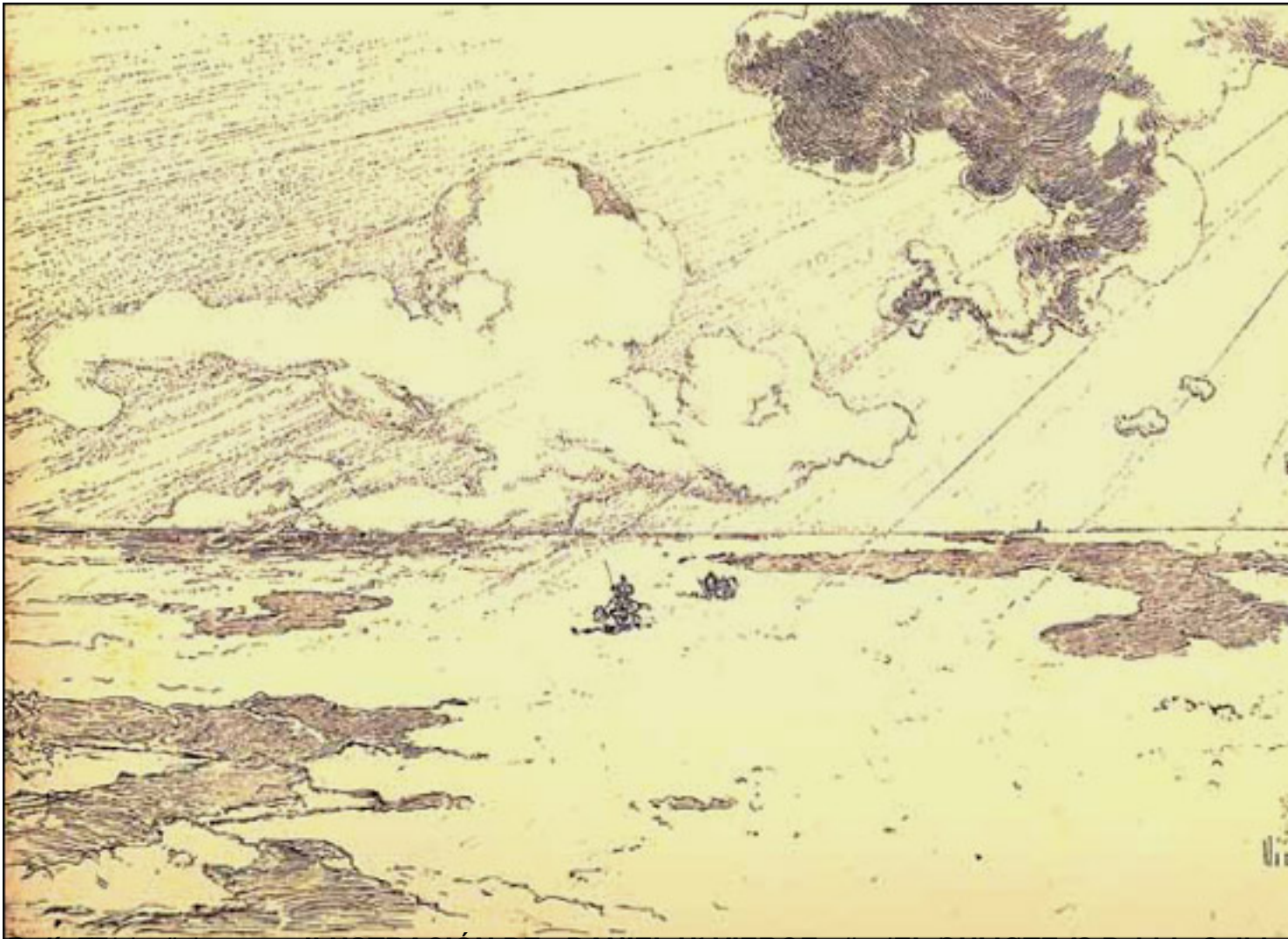
ILUSTRACIÓN DE DANIEL EVERETT para EL QUIJOTE (segunda Salida).

Viernes, 19 de Marzo de 2010 18:15 - Actualizado Jueves, 29 de Abril de 2010 14:39