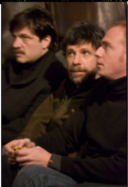
El director de la obra y los actores principales