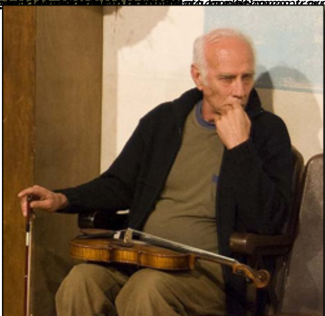
El protagonista de la obra