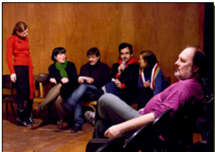
Los ensayos de la obra

Viernes, 19 de Marzo de 2010 17:36 - Actualizado Domingo, 04 de Noviembre de 2012 15:18