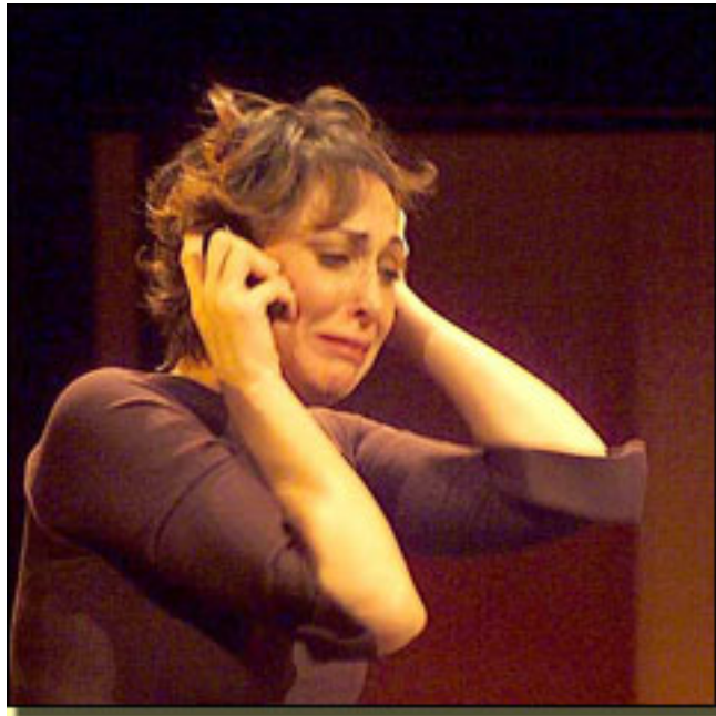
MARÍA BARRANCO