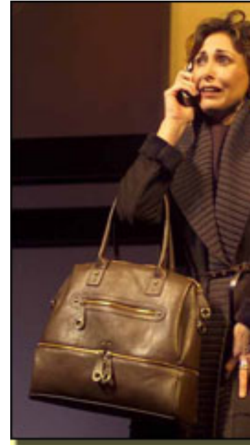
MARÍA BARRANCO