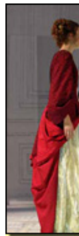
Ella siempre tiene razón. Alceste de Molière

En 1666, Molière y Armande Béjart , pareja de escena y de vida, protagonizaron esta pieza. Mitad burla amarga, mitad comedia, Le Misanthrope ( El misántropo )