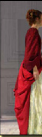
Ella siempre tiene razón. Alceste de Molière

En 1666, Molière y Armande Béjart , pareja de escena y de vida, protagonizaron esta pieza. Mitad burla amarga, mitad comedia, Le Misanthrope ( El misántropo )