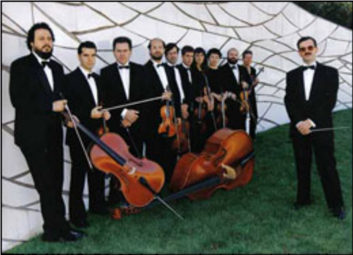
El director de la Orquesta de Veranos de la Villa interpretará obras de Beethoven y Schubert.

Escrito por www.madridteatro.net Martes, 09 de Marzo de 2010 20:05 -