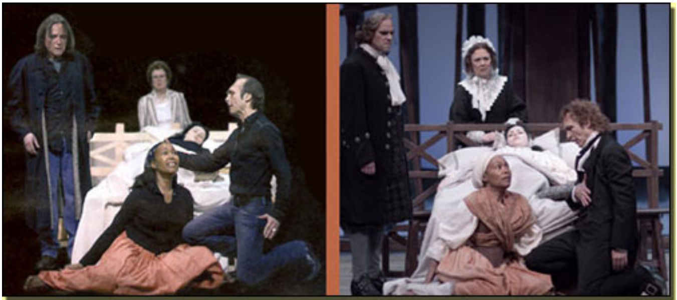
FOTO DE ENSAYO