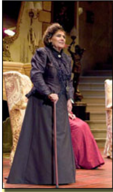
NATI MISTRAL

Domingo, 07 de Marzo de 2010 07:18 - Actualizado Domingo, 07 de Marzo de 2010 07:23