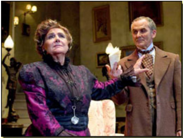
NATI MISTRAL/ CARLOS M. DÍAZ

Domingo, 07 de Marzo de 2010 07:18 - Actualizado Domingo, 07 de Marzo de 2010 07:23