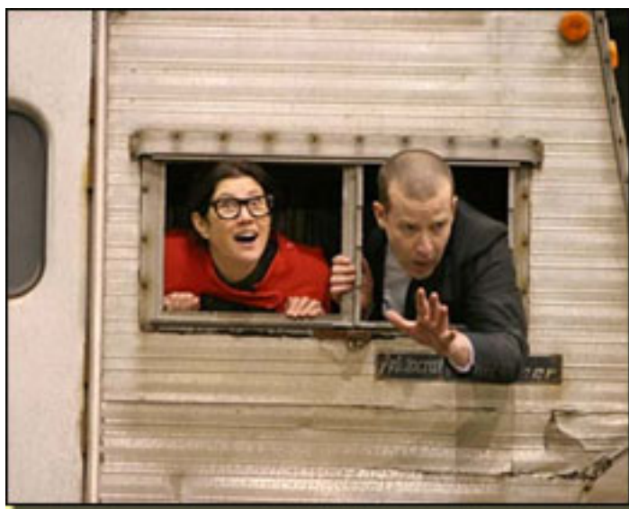
DOF FACE(CARA DE PERRO) DAM JEMMET

- En ese montaje - añade - eliminaron la secuencia de los locos. Y pre