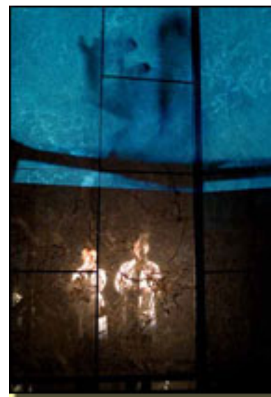
Alberto