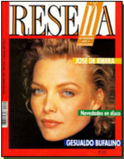
RESEÑA, SEPTIEMBRE 1992 NUM. 231, pp. 16