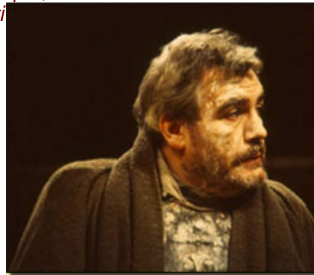
BRIAN COX (TITUS ANDRONICUS)