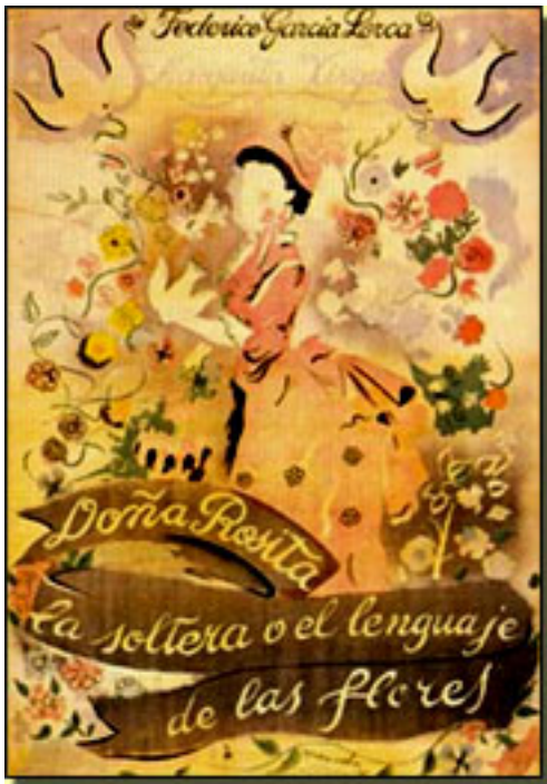
Cartel del estreno

de Margarita Xirgu. HASTA este año “ Doña Rosita la soltera ” ha