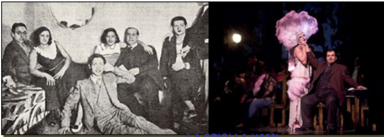
LA CRIOLLA (1930)

Escrito por José R. Díaz Sande. Martes, 16 de Marzo de 2010 19:54 -