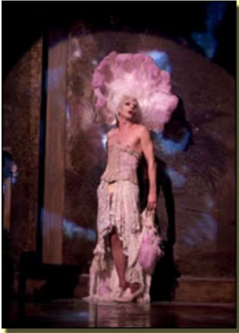
LLUISET (2005)

Es texto (1972) tardó en ver la luz, debido a la censura y también porque no es obra de fácil montaje.