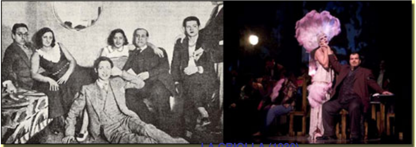
LA CRIOLLA (1930)