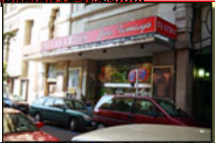
http://www.elpais.com/ a las 21 h30 a 13.30 h.