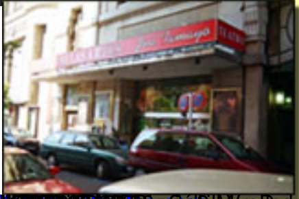
http://www.elpais.com/ a las 21 h30 a 13.30 h.